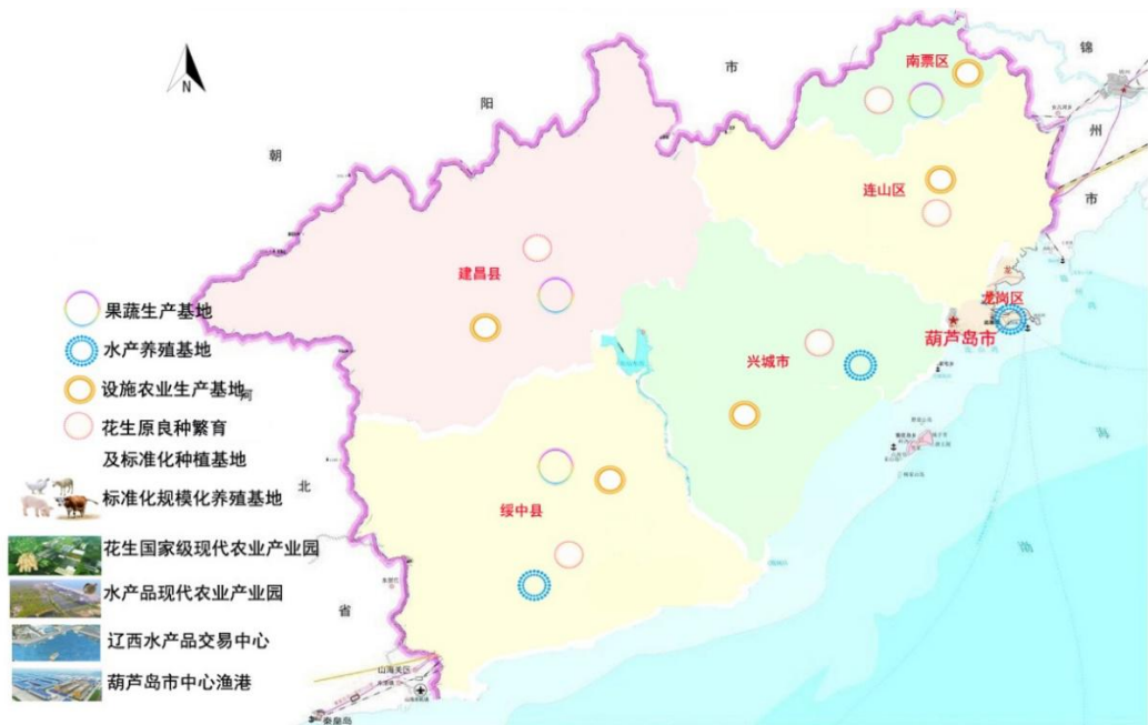
图 6-1 农业产业发展布局图